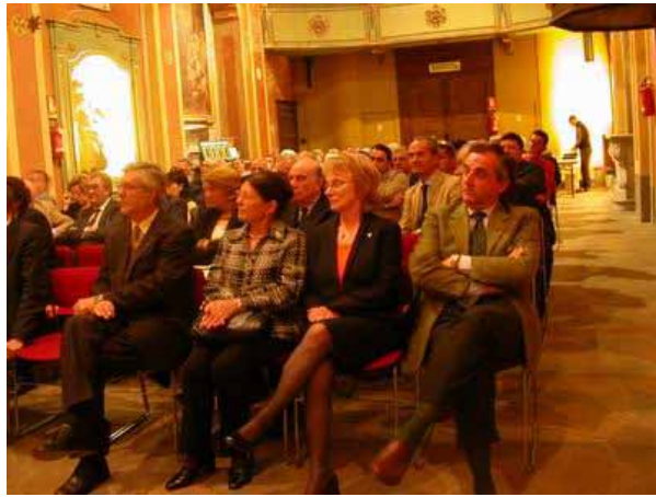
Uno scorcio della Chiesa degli Angeli