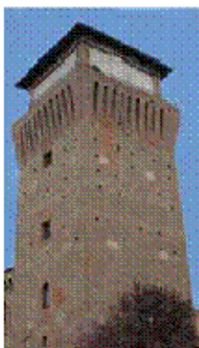
Torre del XIII Secolo Settimo Torinese